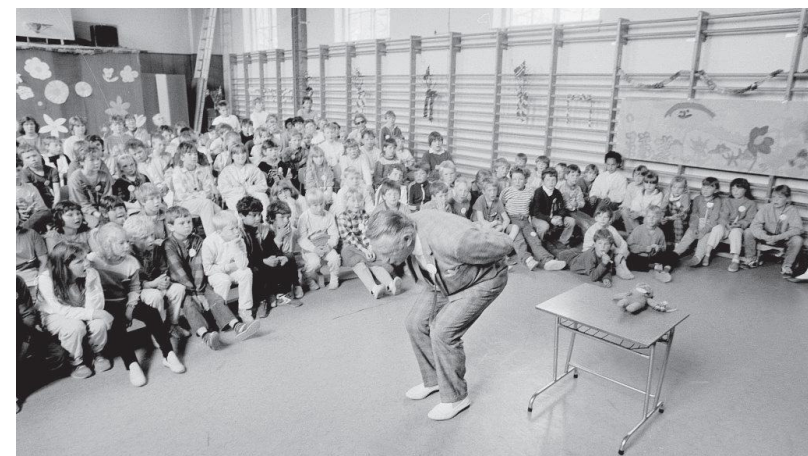
På skolebesøk: Hjallis demonstrerer skøyteknikk til barna under et besøk på Lilleby skole i mai 1986.