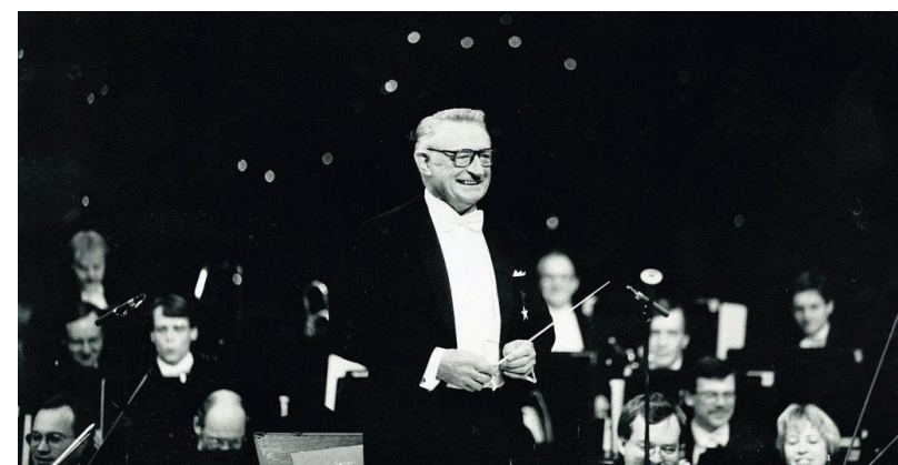
Nyttårskonsert: Hjalmar Andersen under Adresseavisens nyttårskonsert i Olavshallen i 1993.